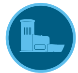
Sensor Rain-Clik Página 151