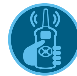
Control remoto ROAM Página 137 Control remoto ROAM XL Página 138