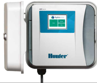
HPC (plástico para interior/exterior) Altura: 22,9 cm Anchura: 25,4 cm Profundidad: 11,4 cm